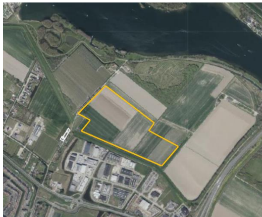
Afbeelding 2. Locatie Zonnepark Seggelant